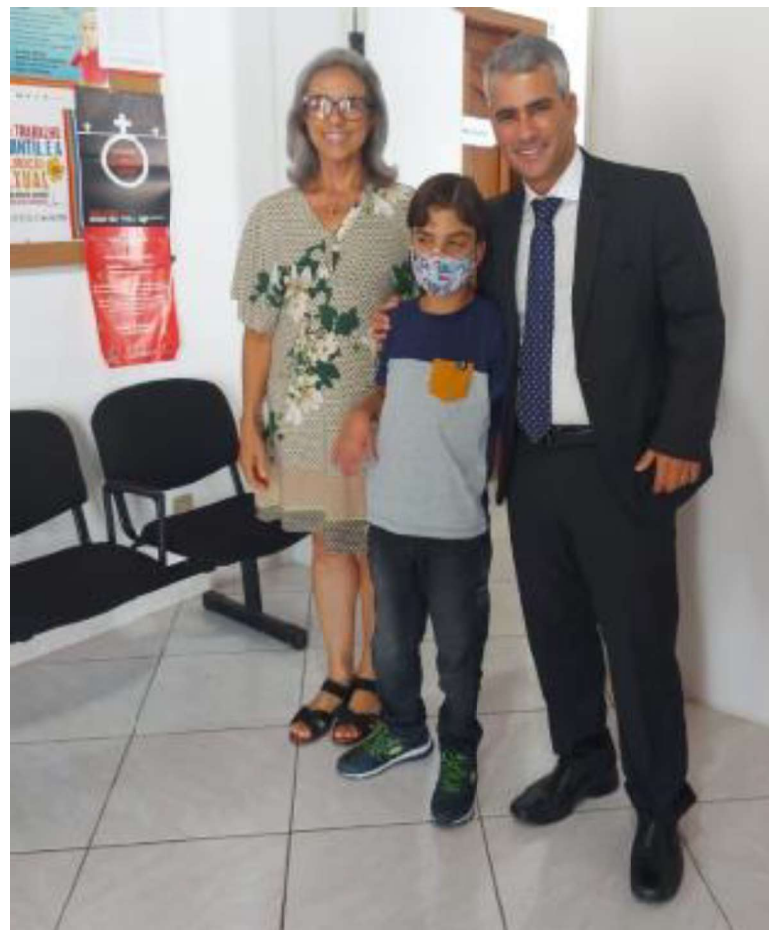
Criança que impulsionou o projeto