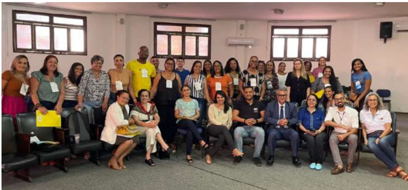
Capacitações de professores