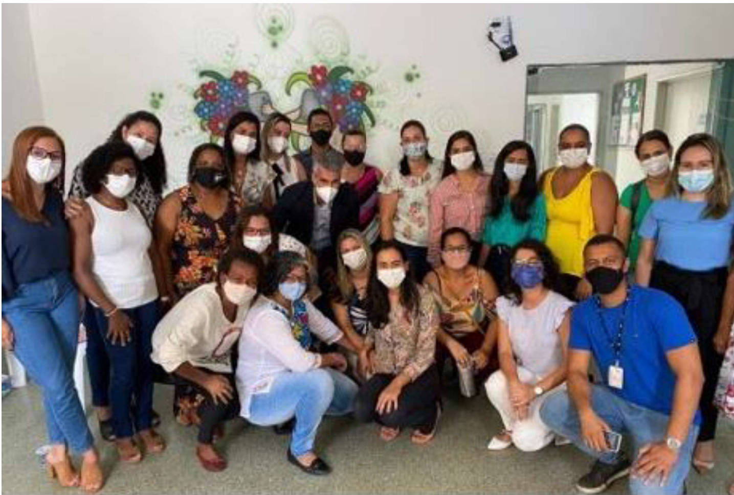
Apresentação dos trabalhos da Equipe Multidisciplinar de Inclusão